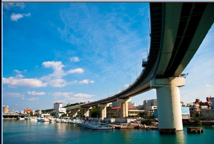
第3回沖測建協フォトコンテスト最優秀賞「泊大橋」